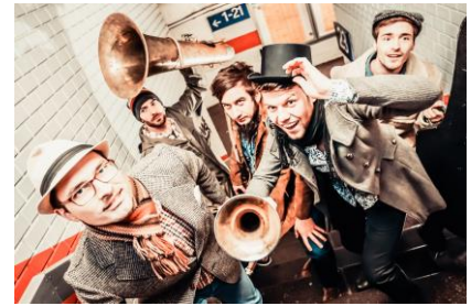
Maik Mondial

Touristinformation Marktheidenfeld Tel. 09391 5035414 www.marktheidenfeld.de