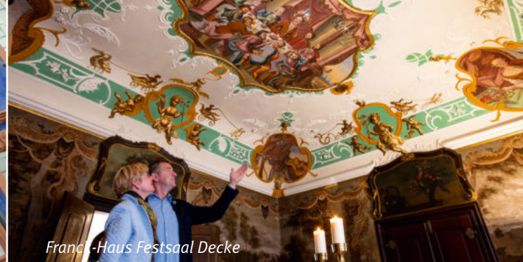
Franck-Haus Festsaal Decke